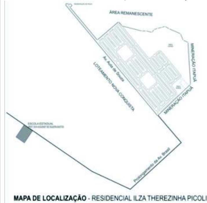
MAPA DE LOCALIZAÇÃO - RESIDENCIAL ILZA THEREZINHA PICOLI

OBS: PARA SER PUBLICADO TRÊS VEZES CONSECUTIVAS, COM O MAPA DE LOCALIZAÇÃO