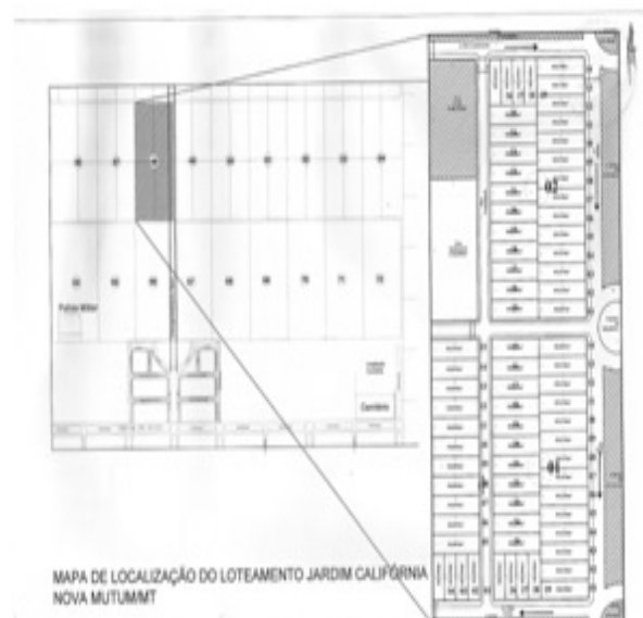
MAPA DE LOCALIZAÇÃO DO LOTEAMENTO JARDIM CALIFÓRNIA NOVA MUTUM-MT