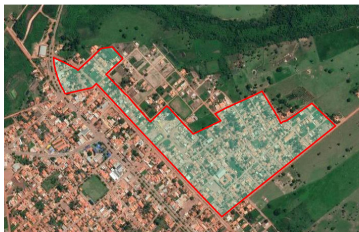
Curvelândia (MT), em 28 de março de 2022.

Jadilson Alves de Souza PREFEITO MUNICIPAL ASPLEMAT Publicações (65) 3365-0800