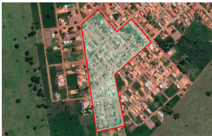
Curvelândia (MT), em 28 de março de 2022.

Jadilson Alves de Souza PREFEITO MUNICIPAL ASPLEMAT Publicações (65) 3365-0800