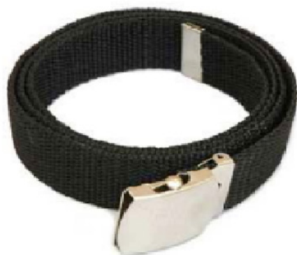
ITEM 02 - CINTO DE NYLON