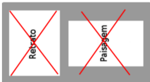
Forma incorreta de digitalização dos documentos