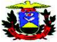
TABELA COMPLEMENTAR DE VALORES VENAIS BASE DE CÁLCULO IPVA 2010