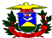
TABELA DE VALORES VENAIS BASE DE CÁLCULO IPVA 2011